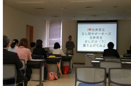
公式アカウント「しろいの魅力市場」 (Facebook・Instagram)