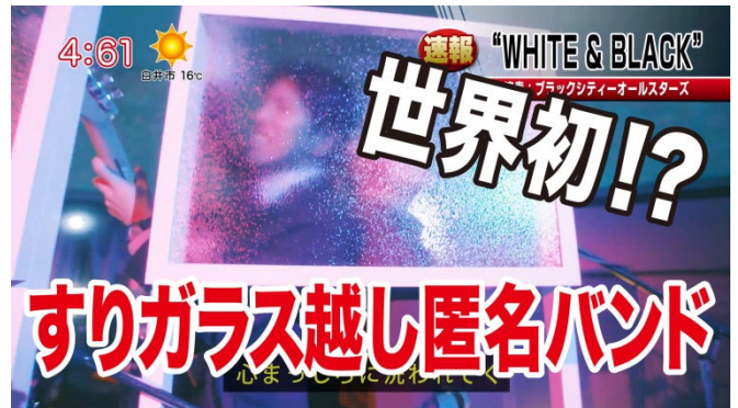
PRムービー「WHITE & BLACK」の1シーン