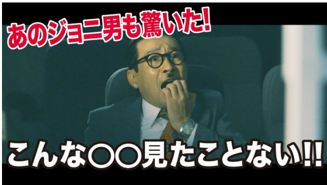
PRムービー「WHITE & BLACK」の1シーン