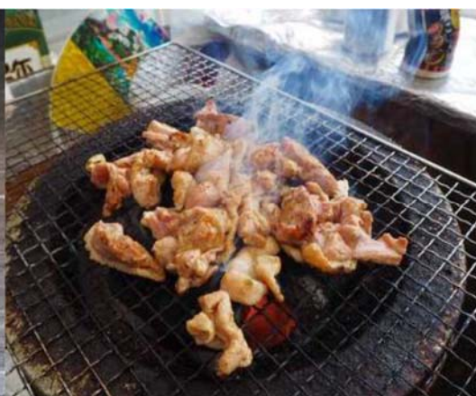
タマシャモ炭火焼き