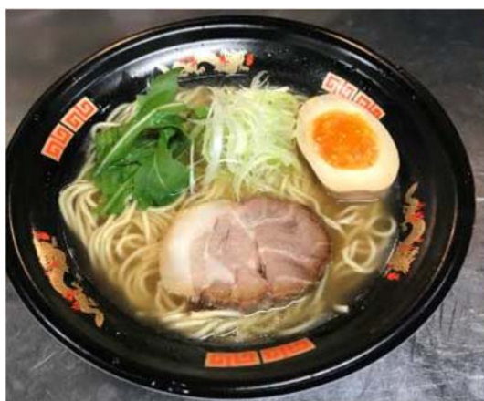
オール埼玉ラーメン

・「オール埼玉ラーメン」や埼玉地鶏タマシャモ炭火焼き、地ビールなどの「埼玉グルメ」をはじめとした20ブースがけやきひろばに集結します。