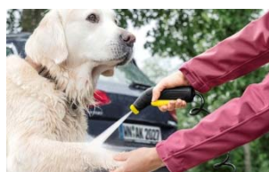
ペットの手足の洗浄