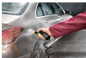
車の軽い汚れ落とし