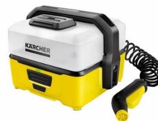
家庭用マルチクリーナー 「OC 3」