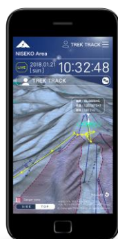
スマホ表示イメージ