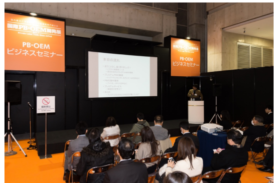
国内外で活躍する専門家が登壇するセミナーも人気