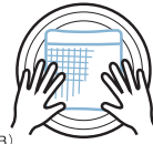
(図B) つけ置きの後、押し洗い。もみ洗いは絶対NG!