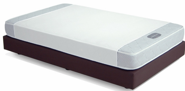
マットレスに巻きつけ面ファスナーで留めるだけ

日本ベッド製造株式会社（本社：東京都大田区／代表取締役社長：宇佐見壽治）は、ホテルのマットレスを水分由来のトラブルから保護するカバー「マットレス防水ラップ」を業務用新商品として2018年4月2日（月）から販売します。