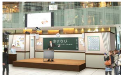
▲オープニングイベントステージイメージ （※変更になる可能性があります）

8目を迎える今年は、総合テーマを「京まなびー知るともっと日本が好きになるー」として、オープニングイベントやパンフレット・公式HPを一新。オープニングでは、ステージの設えを明治150年にちなみ、小学校をモチーフにした教室形式とし、京都に縁のある方々をお招きして、京都を入口に日本の文化についてまんでいただくきっかけとなるトークを展開します。また、イベント期間中は、都内各所で多彩で奥深い京都の魅力を発信する101のプログラムを「見る」「知る」「食べる」の3つのカテゴリーに分けて展開します。例えば、かこいやは期間限定で、冬の京野菜を使ったメニューを楽しめ、クラフトビールを製造販売するスプリングバレーブルワリーでは、様々な京都限定ビールや京素材をアレンジした様々なお料理が味わえます。カフェコムサ銀座店では期間限定で京都文化をイメージしたケーキも販売されます。飲食だけでなく他にも、フコールが京都で開催している人気講座を東京で初めて開催。その他、京職人の技やアートが楽しめる展示会やイベント、その他様々な京都の一面に出会えるイベントをご用意しています。この機会に、皆様に「京まなび」にご参加いただき、京都の魅力を満喫していただければ幸いです。