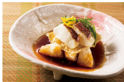
▲真鯛と焼きかぶらポン酢かけ

昨年、大変ご好評いただきました『冬の京野菜まつり』を品書き新たにご用意。真鯛と焼きかぶらポン酢かけや、京野菜サラダなど。他にもさまざまなメニューが登場します。趣向を凝らした逸品は調理長の腕を振るい色彩豊かに楽しめる仕上がりです。「旬」と「本場」の味わいを旨酒片手に都内和食店10店舗にてご堪能いただけます。ぜひ、一度ご賞味ください。