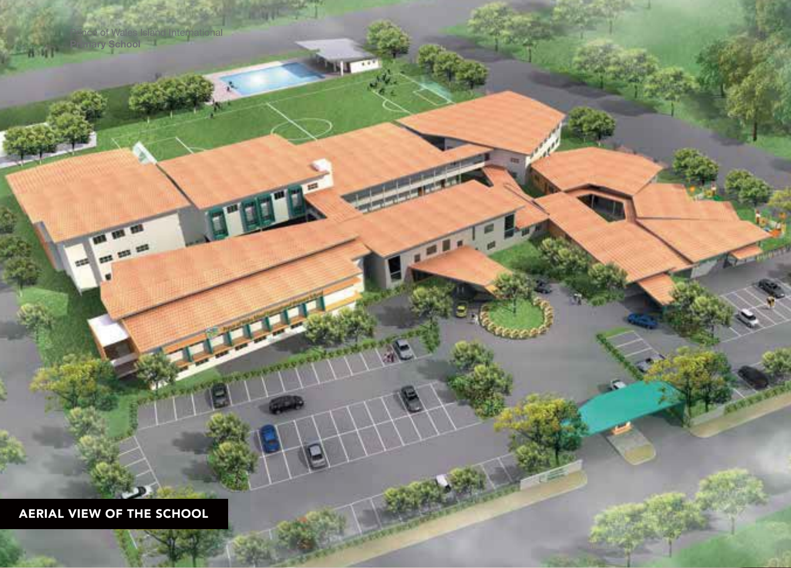
AERIAL VIEW OF THE SCHOOL