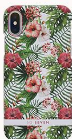
ピンクハイビスカス