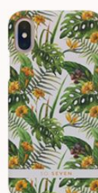
イエローハイビスカス