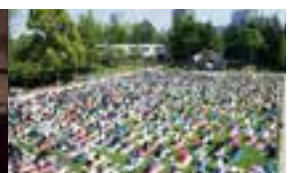
ヨガワークショップ