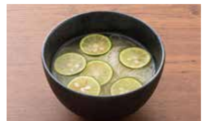
牛だしの酢橘 さっぱりソーメン 580円(税別)

いつかはカレー専門店を出店したいと夢見る私たちが研究した今一番美味しいと思うスパイスたっぷりのカレーは焼肉にズバリ抜群。