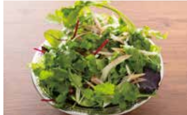
オーガニック ハーブサラダ 830円(税別)

※仕入れ状況により黒毛和牛の場合あり。 ※ライス、いろいろ野菜、スープは別売りになります。