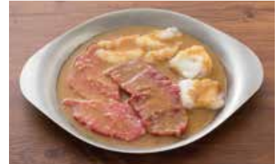
味噌麺だれ盛合せ (おまかせ赤身&ホルモン) 1,680円(税別)

パクチーやミョウガ、グリーンリーフなどのオーガニック野菜を使用したサラダです。さっぱりとした醤油ベースの和の味わいです。