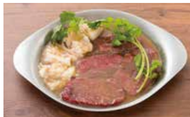
スパイス焼き盛合せ (ラム、おまかせ赤身&ホルモン) 1,980円(税別)

旨みをさらに付け加えるべく自家製でつくった味噌の麺だれに赤ワインを加えて。白ワインを加えた塩麺だれもオススメです。