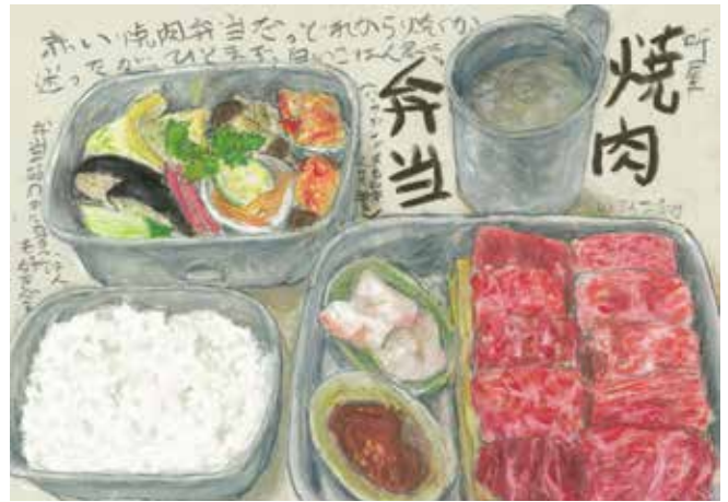
イラスト：マメイケダ

とにかく気軽に来て頂きたい！こだわりのあるオトナも、安心して美味しいものを食べたいご家族も、仕事で疲れてたまには贅沢したいお一人様も。誰でも気軽に、でもちゃんと美味しいもの、安心して安全なものが食べたいお客様に来ていただきたいと思っています。夜中の3時まで開けてるので同業の方も大歓迎！疲れたカラダに、美味しいお肉と自然派ワイン&クラフトビール！最高です！！