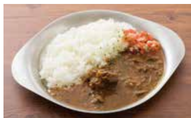
スパイス ミートカレー 780円(税別)

噛むほどに味わいが口の中に広がる黒毛和牛の赤身肉。スタッフが丁寧に旨みを閉じ込めて焼き上げた、塊肉だからこそその味わい。 ※写真は300g