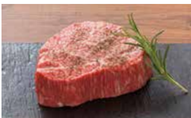
黒毛和牛赤身肉 200g〜 3680円(税別)

焼肉屋さんの肉鍋。ロースターでグツグツ、この肉鍋とライスでも十分楽しめる贅沢な逸品。他にもホルモン鍋とポトフがございます。