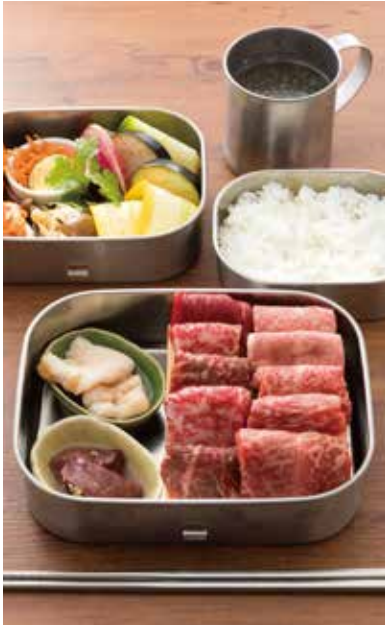
听屋焼肉弁当 黒毛和牛ミックス ハーフポンド (250g) 3,850円(税別)

黒毛和牛の赤身、霜降り、タン、ホルモン(ホルモンは仕入れ状況によっては国産牛)を看板に、定番の焼肉メニューをご用意。また化学調味料を使わない焼肉食堂として、サイドメニューにも様々なこだわりを注いでいます。その他、自然派ワインを多数揃え、クラフトビールも4液種常時設置し、食堂づかいだけでなく、酒場づかいもできるので、深夜まで楽しんでいただけます。