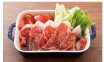
黒毛和牛の霜降り トマトすき焼き 3,500円(税別)

思わずワインやクラフトビールが飲みたくなる！そんなスパイスを効かせて作った自慢のオリジナルソース、ついつい夢中になります。