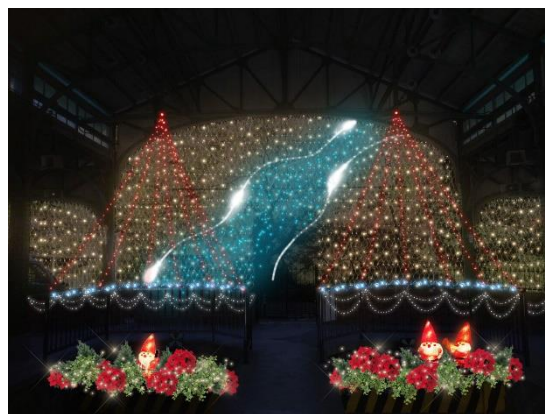
今年は近くを流れる高野川をイメージ