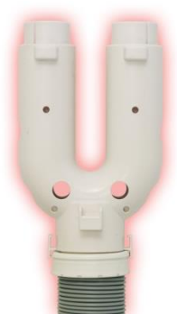
大型ふとん乾燥 アタッチメント