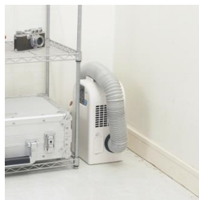
コンパクトサイズ