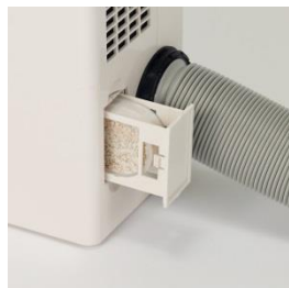
クレベリンLED カートリッジ