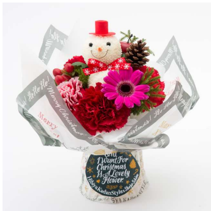
SHOGO SEKINE 氏オリジナルイラストのラッピングペーパーを用いたブーケ「スノーマンシュシュフルール」 税込 3,780 円(本体価格 3,500 円)

そんな想いを"All I Want For Christmas Is A Lovely Flower"というメッセージにこめています。