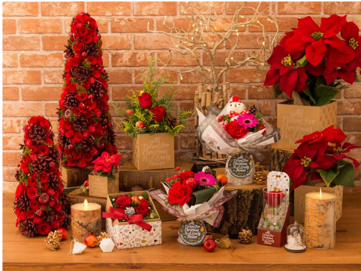
SHOGO SEKINE 氏コラボレーション商品一覧

【SHOGO SEKINE 氏コラボレーション概要】 ※掲載商品はコラボレーション商品の一部です