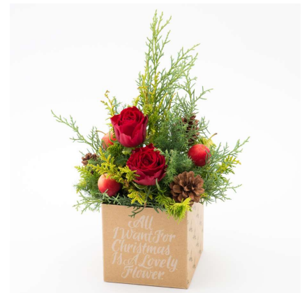
SHOGO SEKINE 氏オリジナルイラストのボックスのアレンジメント「ポム」 税込 5,400 円(本体価格 5,000 円)