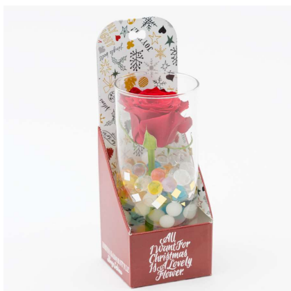
SHOGO SEKINE 氏オリジナルイラストのボックスの生花と花瓶のセット「コンフェッティフルール」 税込 1,620 円(本体価格 1,500 円)