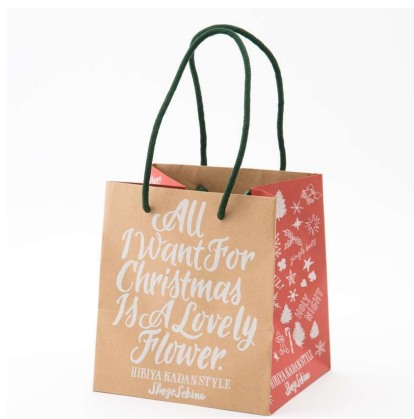
Hibiya-Kadan Style のクリスマスギフトを 購入いただいた商品をいれる SHOGO SEKINE 氏オリジナルイラストの ショッピングバッグ