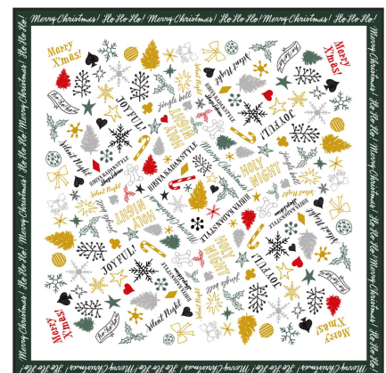
SHOGO SEKINE 氏オリジナルイラストのラッピングペーパー