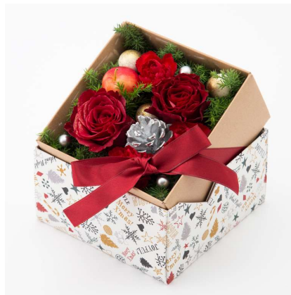
SHOGO SEKINE 氏オリジナルイラストのボックスのアレンジメント「ジャルダン・デュ・ラ・フルール」 税込 3,456 円(本体価格 3,200 円)