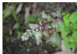
【シソエキス(赤紫蘇)】

肌の炎症を鎮める作用が肌荒れを防ぎます。また、 \alpha -リノレン酸(オメガ3)を豊富に含む活性酸素除去作用、老化予防作用に優れます