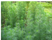
【カワラヨモギ花エキス】

タンニン、フラボノイドを含有し消炎、殺菌効果に優れ肌を清潔に保ち肌荒れを防ぎます