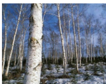
【シラカバ樹皮エキス】

タンニン、サポニン、フラボノイド、ビタミンC等含有で抗炎症、取れん、保湿などコンディショニング効果に優れます