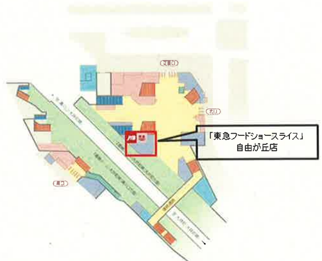
▲自由が丘店位置図

「東急トラベルサロン自由が丘駅」 平日:午前10時30分～午後20時00分(平日) 土曜・日曜・祝日:午前10時30分～午後18時30分 ※パンフレットラックはベーカリー営業時間内でもご利用頂けます。