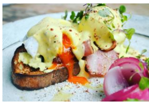
エッグベネディクト