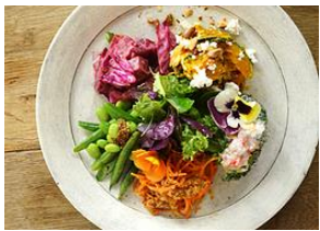
季節野菜のサラダ& デリプレート