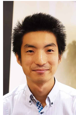
UCCホールディングス株式会社

EC-Rider B2Bは、BtoBならではの専門性が高い要求に応えるだけでなく、変化しつづけるシステムに対応できる柔軟性を備え、専門家から成るチームが付いていた。喫茶店文化を支えるフーズフリッジの事業の背後では、今日もEC-Rider B2Bが動き続けている。