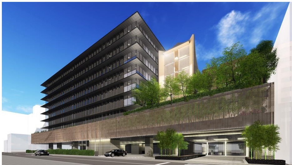
ホテル正面（イメージ）