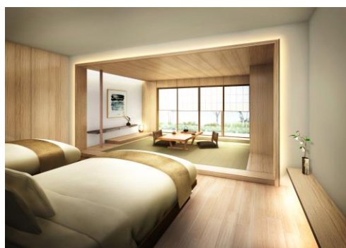
ガーデンスイート