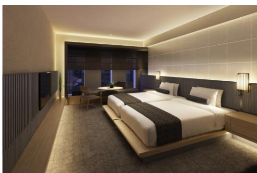
スタンダードツイン