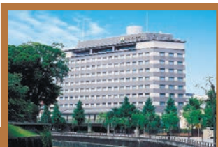
アークホテル熊本城前