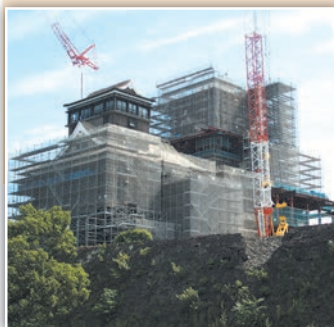
熊本城 熊本地震の被災と復興のシンボル「熊本城」は初日にご案内します。