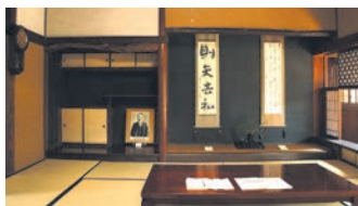
漱石が暮らした「 内坪井の家 」 【第5番目の家】