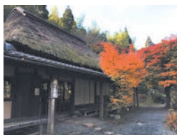
鳥越峠の茶屋 有名な草枕の一節「おい、と声をかけたが返事がない」はどちらかの茶屋が舞台といわれています。

彼は4年3ヶ月の熊本滞在期間中に6回も転居。その中で最も長い1年8ヶ月を暮らした家です。漱石が暮らした家が当時の場所に残って公開されているのは全国でもこの旧居だけです。