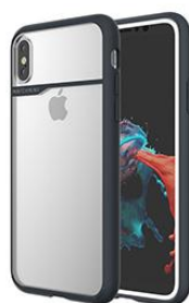
NAVY BLUE ネイビーブルー