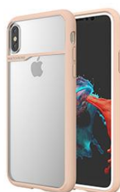
PALEWOOD PINK パールウッドピンク