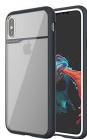
NAVY BLUE (HALF MIRROR) ネイビーブルー (ハーフミラー)