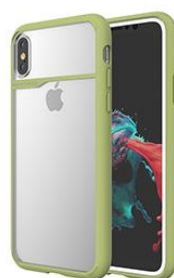
OLIVE GREEN オリーブグリーン