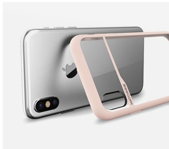
iPhoneのデザインを楽しめる クリアパネル