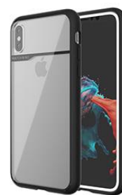
BLACK (HALF MIRROR) ブラック (ハーフミラー)