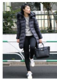
TATRAS & STRADA EST わらわ... HOLY