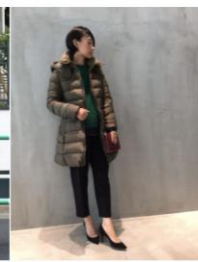
TATRAS & STRADA EST わらわ... HOLY