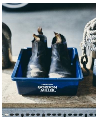
GORDON MILLER マルチトレイ 5L