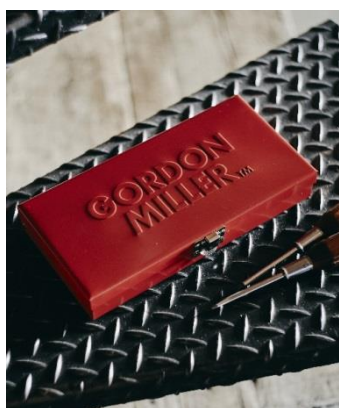
GORDON MILLER メタルケース レッド M