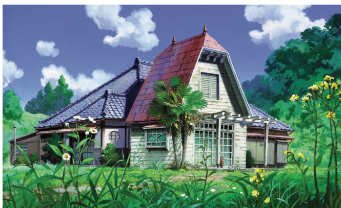
となりのトトロ © 1988 Studio Ghibli