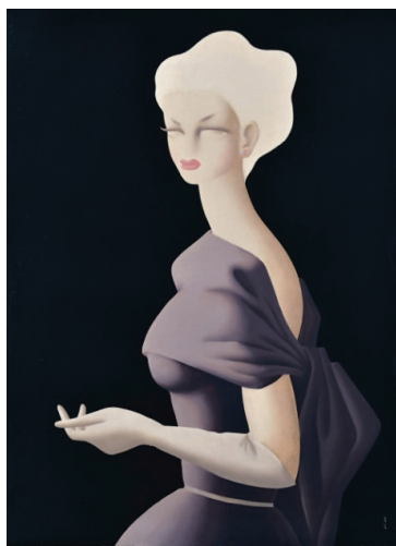
《バイオレット》東郷青児 1952年 損保ジャパン日本興亜

開催趣旨：東郷青児(1897-1978)は日本最初期の前衛絵画から昭和のモダン文化を彩るデザインの仕事、さらには美と抒情を統合した比類ない女性像まで、生涯にわたってさまざまな造形的挑戦を続けました。本展では、「東郷様式」と呼ばれた独特のスタイルが確立する1950年代末までを中心に、逸品と希少品を一堂に集め、その画風の形成をひもときます。