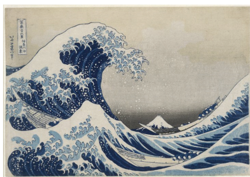
《富嶽三十六景神奈川沖浪裏》天保元～4年 (1830～33)頃 大英博物館 © The Trustees of the British Museum. Acquired with the assistance of the Art Fund.