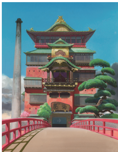
千と千尋の神隠し

開催趣旨：ジブリ作品に登場する、どこかに存在していそうな架空の建造物。本展では、その印象的な建物に注目し、建築家 藤森照信氏の監修により紹介します。「風の谷のナウシカ」から「思い出のマーニー」まで、背景画や美術ボード、美術設定といった制作資料400点以上と、大小の立体模型を展示。物語の舞台である、空想的で現実的な空間へのこだわりを迫ります。