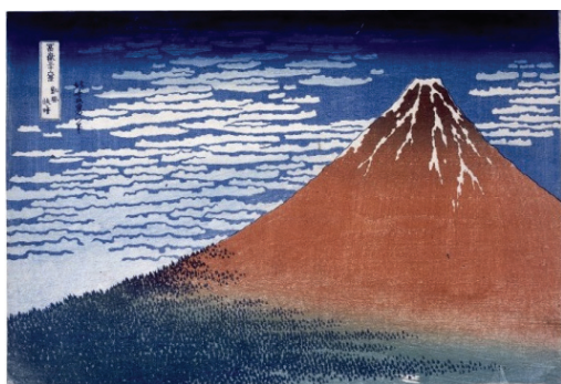
《富嶽三十六景凱風快晴》天保元～4年(1830～33)頃 大英博物館

本展では、肉筆画を中心に還暦以降の30年に焦点を当て、90歳まで描き続けた北斎が追い求めた世界に迫ります。