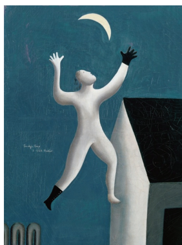
《超現実派の散歩》1929年 油彩・キャンヴァス 東郷青児記念 損保ジャパン日本興亜美術館