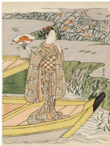
《見立玉虫 屋島の合戦》鈴木春信 中判錦絵2枚続のうち 左 明和3-4年(1766-67)頃 ポストン美術館蔵

開催趣旨：希少な浮世絵を多数所蔵していることで名高いボストン美術館。中でも、錦絵創始期の第一人者として知られる春信のコレクションは世界最高と称されています。本展では、選りすぐりの作品により春信の神髄をご覧ください。また、周辺の浮世絵師たちのコーナーを設け、春信を生み出した時代の気風を浮かび上がらせます。