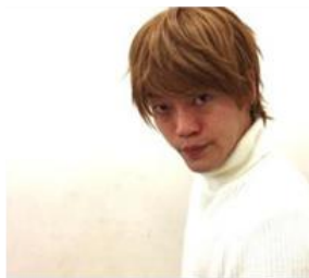
・おばたのお兄さん