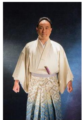
・レーザーラモンRG