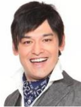
・シャンプーハットてつじ