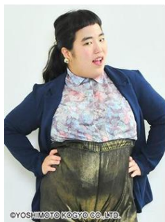
・ゆりやんレトリバア