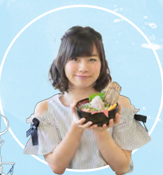
SKE48 青木詩織 (やいづ親善大使)

お車・自転車をご利用の場合 お客様専用駐車場がございます。 www.rise.sc/access/ 詳しくは右のHPをご確認下さい。 ※土・日・祝は大変混雑しますので、なるべく公共の交通機関をご利用ください。