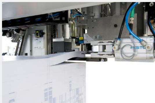
パレットからグリッパーで搬送