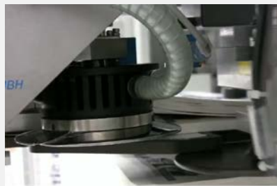
GTS社製 カウンティングデバイス