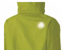
右肩後ろに反射材