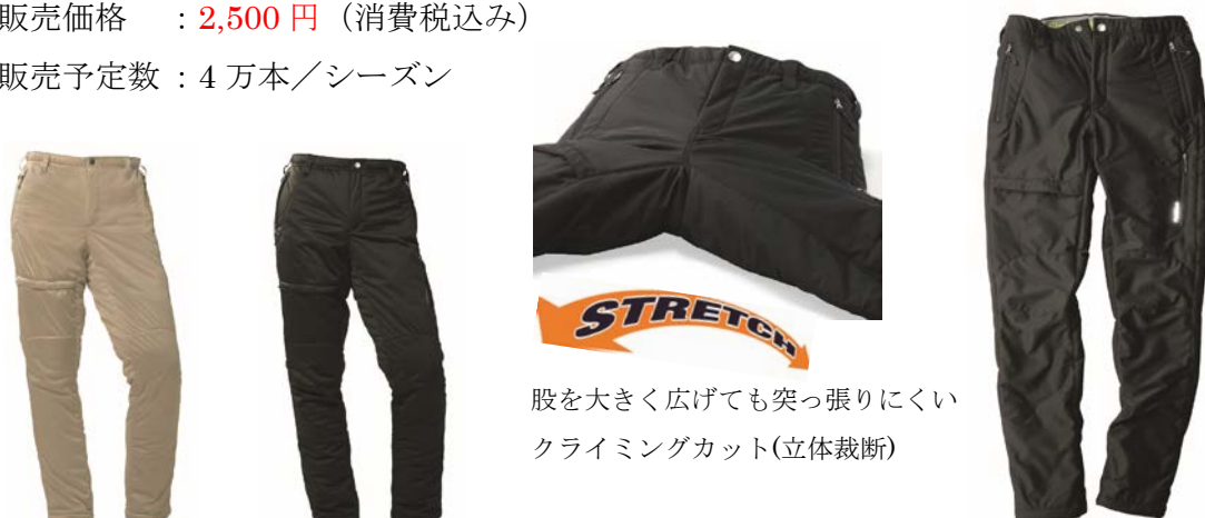
股を大きく広げても突っ張りにくい クライミングカット(立体裁断)