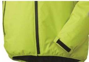
後部が長いサイクルカット