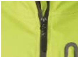
YKK 製止水ファスナー