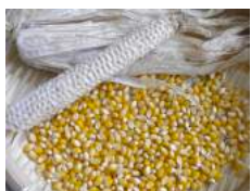
①トウモロコシ胚芽油