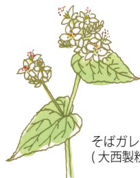
そばガレット (大西製粉)