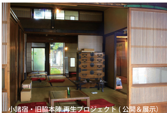
小諸宿・旧脇本陣再生プロジェクト (公開&展示)