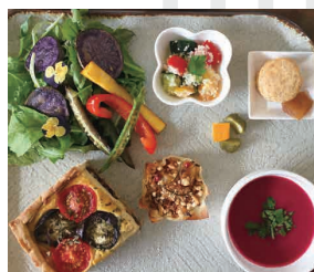
昨年のランチカフェ