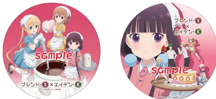
コラボヘッドマークのイメージ

※運転時間は日によって異なります。また、車両点検やその他の理由により運休や運行期間終了日を変更することがありますのであらかじめご了承ください。