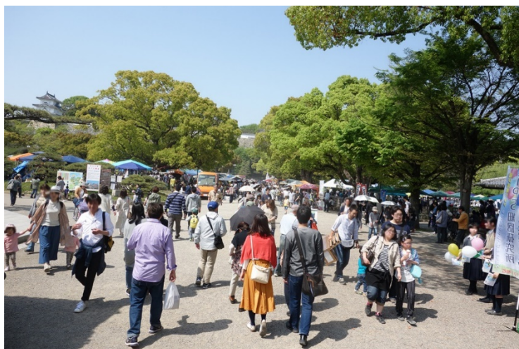
【兵庫県にて開催の様子】

内容：ハンドメイドのインテリア雑貨、アクセサリ、小物や健康、美容体験のワークショップなど、店舗ブースが140以上登場します。興味のある店舗ブースに立ち寄り、交流を深めながらグルメやイベントをお楽しみいただけます。大阪では初めての開催となるイベントです。