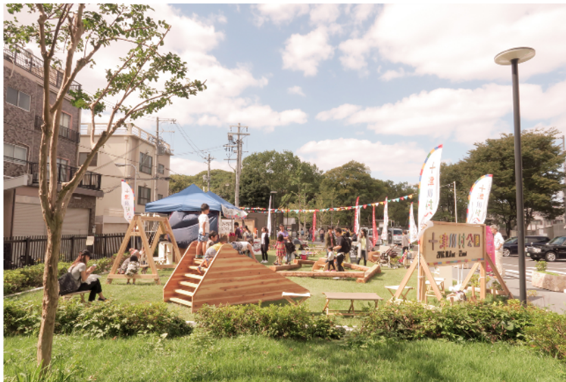
【昨年の開催の様子（天王寺公園茶臼山エリア）】

内容：「てんしば」に期間限定で、十津川村の木で創った木製遊具を配置した「十津川村公園」を開園します。10月7日（土）～9日（月）は木工体験のワークショップや飲食・物販テントなども出店され、十津川村の自然を体感することができます。