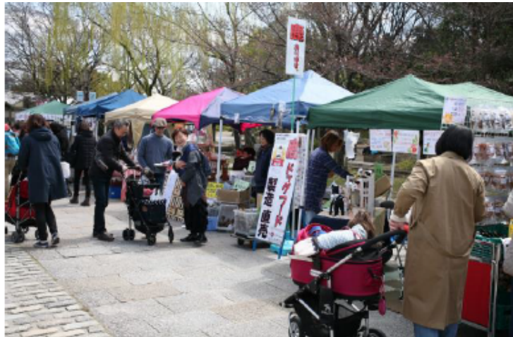
【マルシェ出店イメージ】

内容：手作りを中心とした、犬用に特化したグッズを扱うマルシェが約40店舗登場します。また、人も犬も心地よいサウンドの音楽ライブや、ドッグトレーナー達による犬とのダンスステージやドッグヨガなど、犬にとっても来場者にとっても楽しいイベントが盛りだくさんです。当日限定で、ペット同伴では立ち入れない芝生エントランスにも一緒に入っただけです。都会の真ん中の「てんしば」で、愛犬と過ごす週末をお楽しみください。てんしばでは初めての開催となるイベントです。