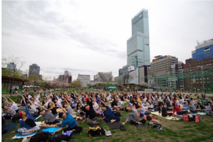
【本年夏開催の様子】