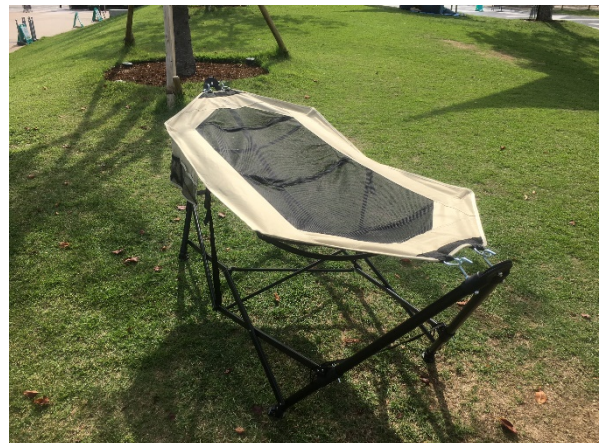
【ハンモックのイメージ】