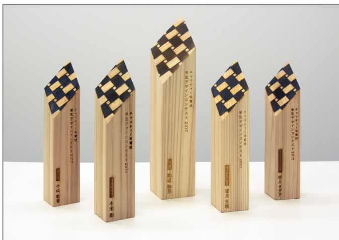
製作協力：（株）石巻工房、（株）くりこまくんえん

宮城県栗駒山で育った杉を材料に製作した受賞者向けトロフィー。この地域の木材は、専門機関による分析で安全であることが証明されているにもかかわらず、今も福島原発事故の風評被害を受けています。