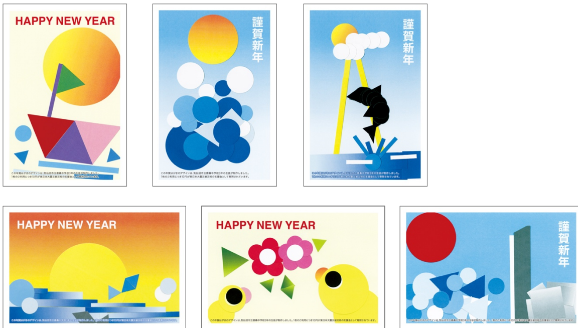
※気仙沼市立唐桑中学校の生徒が作った年賀状のデザイン（一部）

一昨年度より「チャリティー年賀状」は、東北の震災被災校で行う「チャリティー年賀状 デザイン教室」から生まれた作品も加わっています。