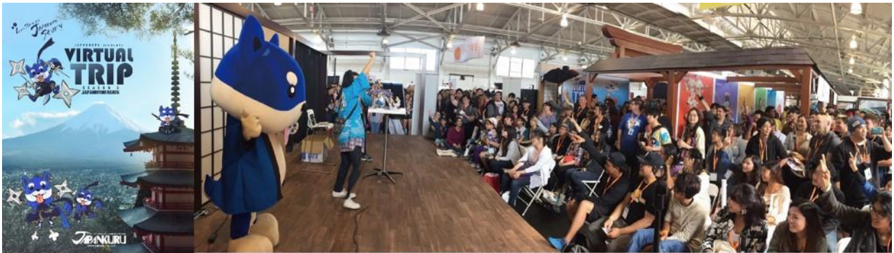
左：トラベルパビリオンのメインイメージ 右：2016 ブースステージ様子

JAPANKURU がプロデュースするトラベルパビリオンは、昨年同様、本当に日本を旅しているかのような体験ができる仮想旅行をコンセプトに、「VIRTUAL TRIP season2」と題して展開します。浴衣の着付けや書道などの文化体験の他、各地方の魅力的な情報を提供するブース設置、ステージパフォーマンスやイベントを行う予定です。また、JAPANKURU オリジナルの360°VR映像を通じ、まるで日本のホットスポットに瞬間移動したような仮想旅行体験も提供します。