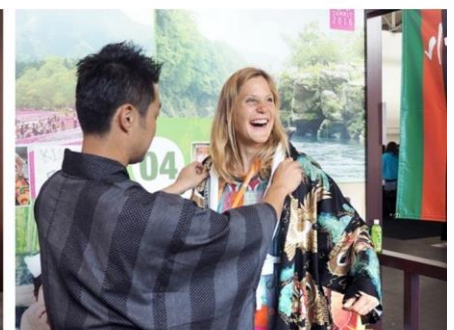
2016 J-POPサミット「トラベルパビリオン」様子