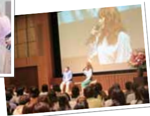
★ 昨年の会場の様子