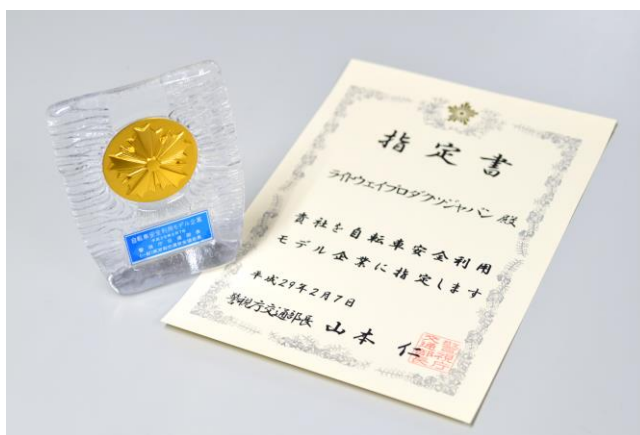
警視庁から交付された指定書と、交通安全協会から贈呈された盾

資料作成のために発生する多くの時間が企業における自転車の導入のネックとなっていると考え、当社だけでなくより多くの企業が自転車を安全に利用できるようになることを目的とし、この度、自転車利用に関する社内規則を一般に公開いたしました。下記のリンクよりダウンロードのうえ流用することで迅速に自転車安全利用のルールが施行できます。