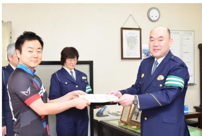
自転車安全利用モデル企業に認定いただいた時の様子

当社は2010年より運用していた自転車通勤規則に、安全運転講習や保険加入とヘルメットの義務化、自転車通勤手当などを追記し拡充し実施して参りました。これらの取組みにより2017年2月7日に警視庁より自転車の安全利用に積極的に取り組む企業である「自転車安全利用モデル企業」として認定を受けた当社は、その後も積極的な自転車の安全利用について進め、駐輪や申請書などに関するさまざまな社内規則を作成いたしました。