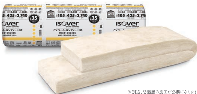
※別途、防湿層の施工が必要になります