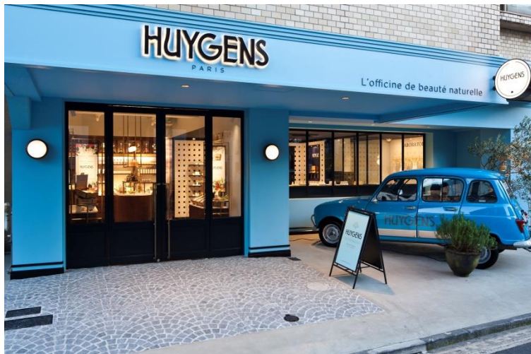
鮮やかなブルーとアイコンカーが目印の「HUYGENS TOKYO」 東京都港区北青山3-9-19(各線「表参道駅」A1出口より徒歩2分)