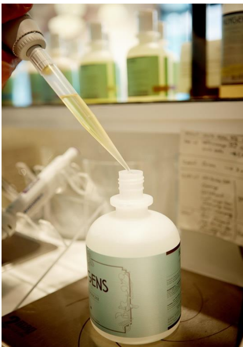
専用の器材を使用したビスポーク