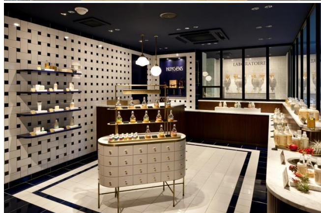
お好みの香りを店内のラボで調合するビスポークスタイル