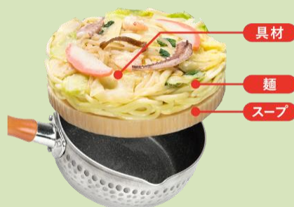
写真は「お水がいらない 長崎ちゃんぽん発祥の店四海樓」です。