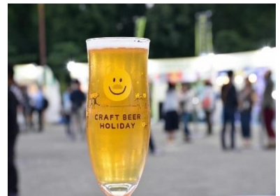
※デザインはイメージです。写真は前回開催時より