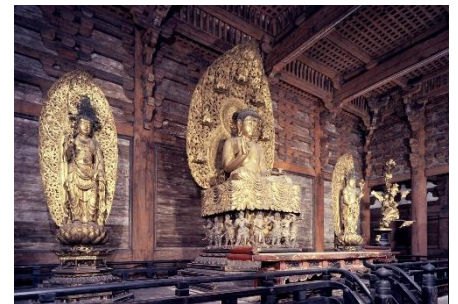
◎東寺 金堂内薬師三尊・十二神将

文明18年(1486年)に焼失。現在のものは豊臣秀頼が発願し、再興。慶長8年(1603年)に竣工。豪華雄大な気風みなぎる桃山時代の代表的建築。重要文化財である薬師三尊(日光菩薩、月光菩薩、薬師如来)と、薬師如来の台座周囲に配された十二神将がある。