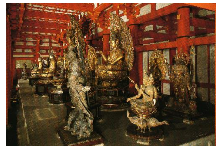
◎東寺 講堂内 立体曼荼羅

安置される二十一軀の仏像は立体曼荼羅として、弘法大師の密教の教えが表現されている。