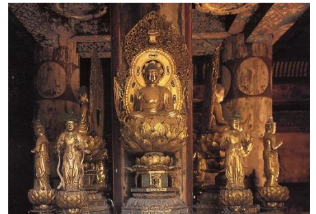
◎東寺 五重塔 心柱を囲む四仏坐像

天長3年(826年)弘法大師の創建着手にはじまる。雷火の焼失などにより、現在の塔は5代目。現在の塔は徳川家光の寄進によって竣工した総高54.8メートルの現存する日本の古塔の中で最も高い塔。細部の組もの手法は純和様を守る、江戸時代前期の秀作。