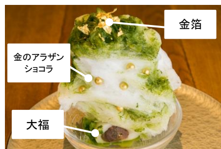
「宇治抹茶の宝当かき氷」断面