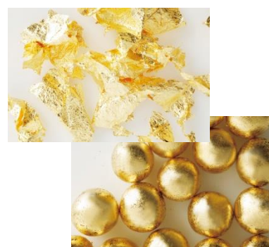
「金箔の切り廻し」(上)と 「金のアラザンショコラ」(下)