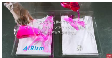
※上記画像それぞれ、(左) 消臭機能付きインナー (エアリズム) (右) 綿インナー