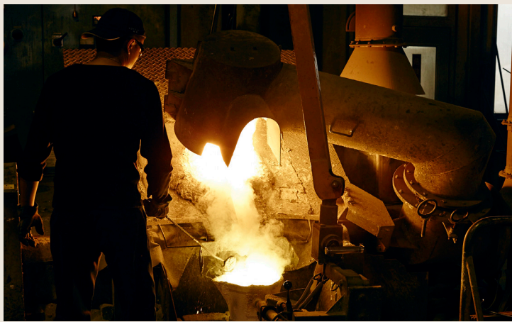
高岡銅器：千数百度の高温で溶かした金属を型に流し込む鑄造法