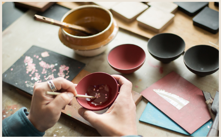
高岡漆器：彫刻や螺鈿細工を施した高度な加飾技術