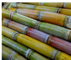
シュガースクワラン