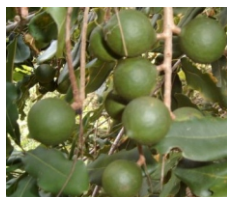
マカダミアナッツ