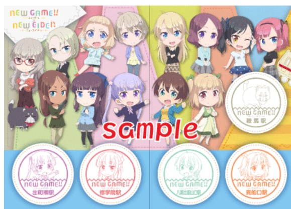
コラボラッピングとコラボきっぷの台紙イメージ