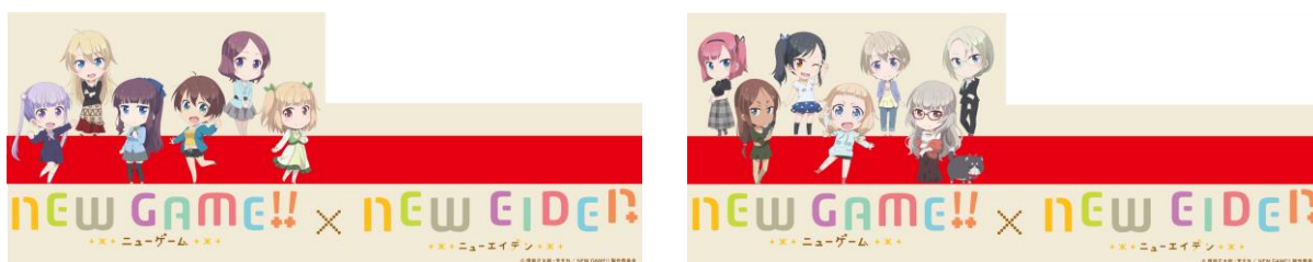
車体側面ラッピングのイメージ

※運転時間は日によって異なります。また、車両点検やその他の理由により運休や運行期間終了日を変更することがありますのであらかじめご了承ください。