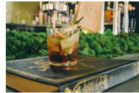
【The Roots of all evil.】