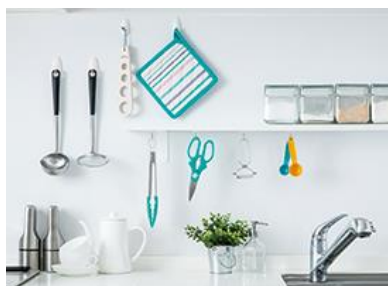
キッチン用品の壁面収納に