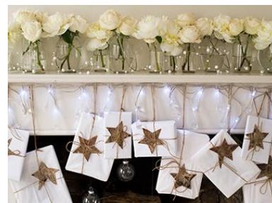
季節のデコレーションに