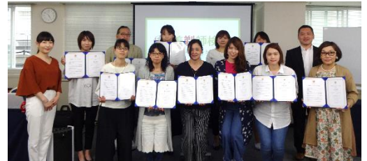
《東京会場》筆記考査の様子（上） 《札幌会場》札幌第一期生 2017.5（下）