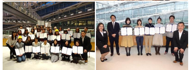
《東京会場》第一期9月生 2016.9 (上) 第一期12月生 2016.12 (左) 第一期3月生 2017.3 (右)