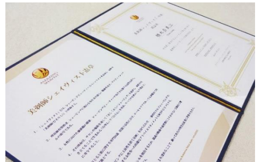
アメイジングシェイヴィストの認証状 サロン現場で掲出できるホルダー付で進呈

積極的な発言と当事者意識、筆記考査正答率70%以上（70%未満は認証留保で追試あり）初級認証のシェイヴィストには「本人理容師免許番号入」の認証状と特製ピンバッジを授与